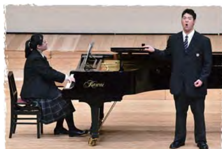
ヴェルディ「椿姫」よりアリア『プロヴァンスの海と陸』