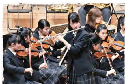
モーツァルト「フルート協奏曲第2番 K.313」より第1楽章