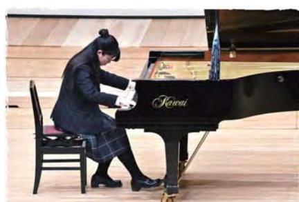
リスト「伝説」より『波を渡るパオラの聖フランチェスコ』