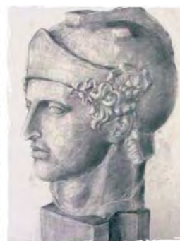
歳桃鈴奈「マルス」(デッサン)