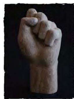
元由彩希「木彫・手」(彫刻)