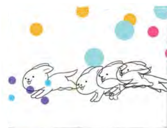
黒島真緒「アニメーション」(メディア)