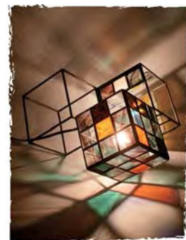
福田晃樹「スタンドグラス」(クラフト)